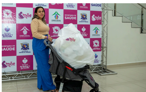
O kit é composto por mais de 30 itens essenciais para os primeiros cuidados

Neste ano, o enxoval foi ampliado e passou a incluir três novos componentes: inalador, lençol para berço e travesseiro antirrefluxo. Além dos kits, o programa oferece suporte completo às gestantes, com palestras, exercícios físicos adaptados, acompanhamento psicológico, nutricional e social. As ações têm como objetivo preparar as mulheres para o parto.