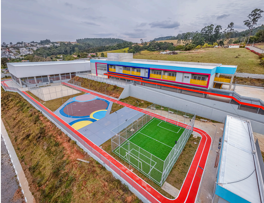
Mais de 200 obras foram entregues nos últimos anos para garantir melhoria contínua na qualidade de vida

Na área da saúde, a principal conquista é a construção do novo Hospital e Maternidade Municipal, realizada com recursos próprios. Com cerca de 14 mil metros quadrados, a unidade contará com 200 leitos e reunirá o