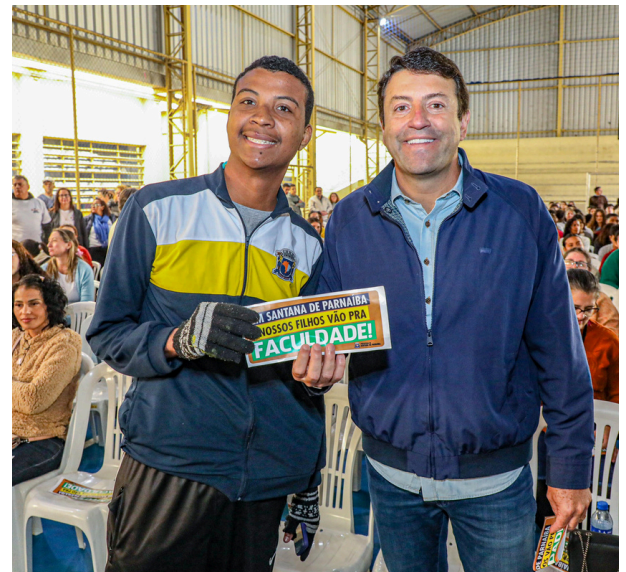
A iniciativa contempla estudantes da 3ª série do Ensino Médio e alunos do 9º ano

O prefeito de Santana de Parnaíba, Elvis Cezar, por meio da Secretaria de Educação, realizou a aula inaugural da 11ª edição do projeto Cursinho Pré-Vestibular e ENEM 2025 e do Cursinho Pré-ETEC 2025. A iniciativa contemplou estudantes da 3ª série do Ensino Médio e alunos do 9º ano, oferecendo duas modalidades de preparação para os principais exames acadêmicos do país.