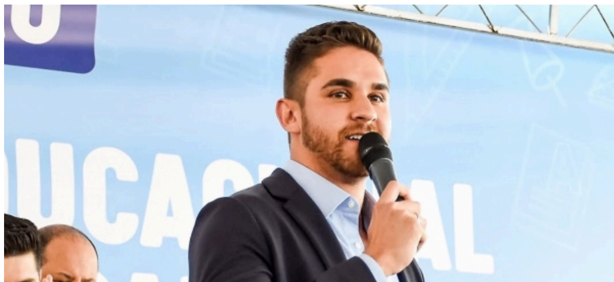
Kauan Berto anuncia contratação de 30 novos profissionais para reforçar a rede municipal de saúde de Cajamar, fortalecendo o atendimento na cidade

"Acabei de assinar a contratação de mais 30 profissionais para reforçar nossa rede de saúde. Vocês sabem que meu compromisso sempre foi com a saúde da nossa população e a gente vem avançando a cada dia", afirmou o