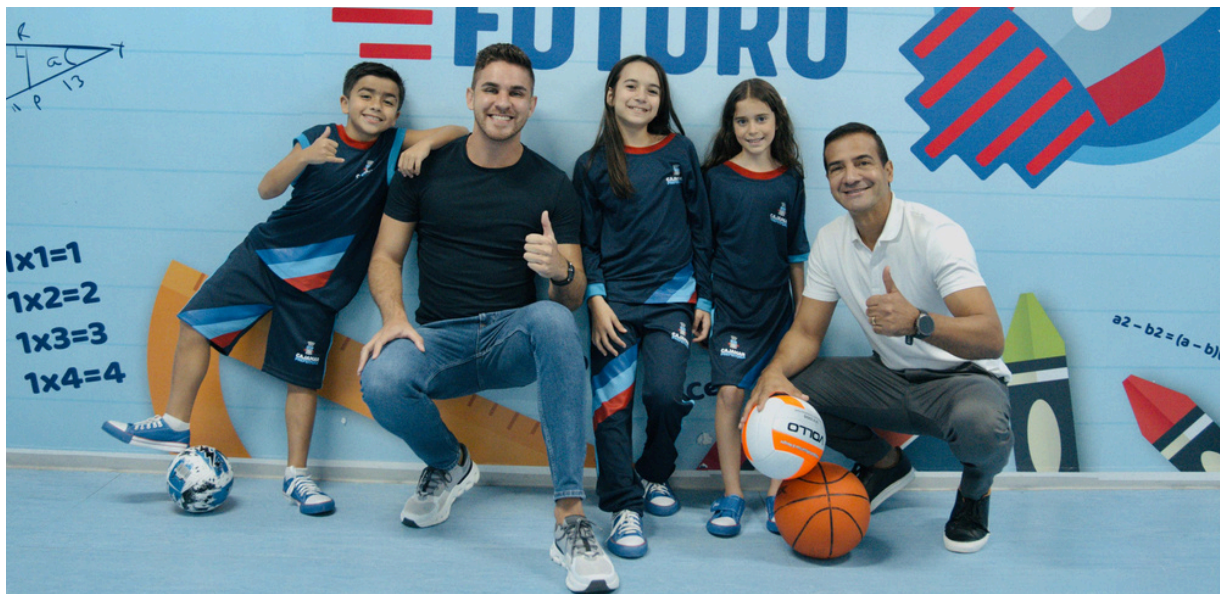
Prefeito Kauan Berto anuncia novos modelos de uniformes escolares para os alunos da Rede Municipal, visando atender às diferentes condições climáticas ao longo do ano

Serão dois modelos de uniformes: um para o verão, na cor azul, e outro para o inverno, na cor cinza. A escolha das peças e dos tecidos foi cuidadosamente pensada para garantir durabilidade, praticidade e conforto, atendendo às diferentes condições climáticas ao longo do ano e proporcionando mais liberdade e segurança para os diversos alunos em todas as atividades escolares.