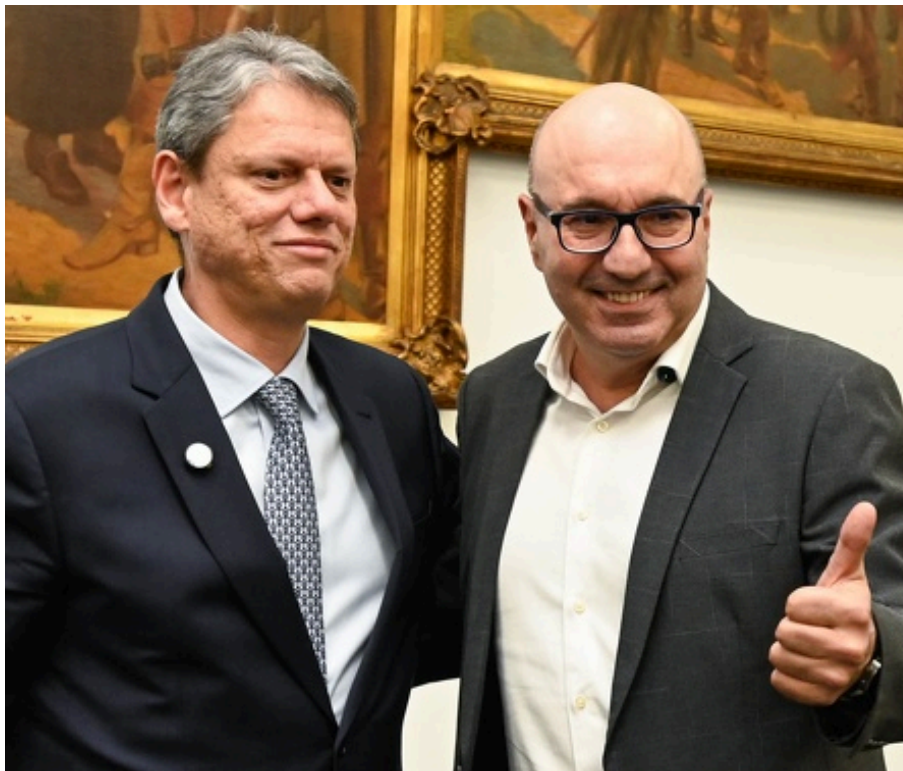
Prefeito Dário Saadi e governador Tarcísio de Freitas na assinatura do Centro de Ciência e Tecnologia do Exército

O parque será instalado em uma área de cerca de 200 mil metros quadrados pertencente ao Exército, localizada entre Campinas e Valinhos, na Coudelaria. A estrutura será voltada para empresas especiali-