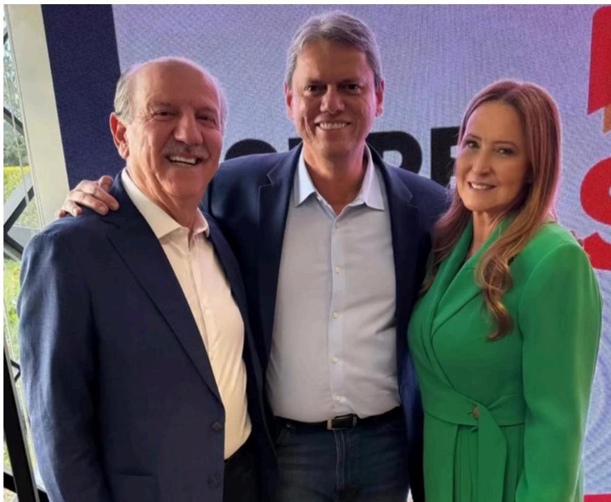
Beto Piteri e Damaris Piteri assinam convênio do programa Super Ação com o governador Tarcísio

O programa prevê a implementação de ações integradas de assistência social, voltadas especialmente para famílias em situação de vulnerabilidade. Entre