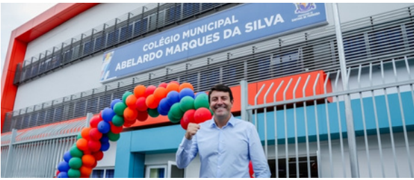
Inauguração novo Colégio Abelardo na Fazendinha