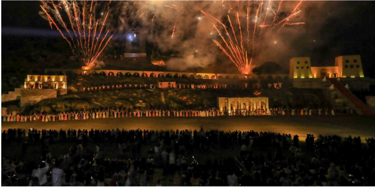
Drama da Paixão em Santana de Parnaíba foi sucesso de público e visualizações

Na edição deste ano, a primeira parte do espetáculo teve como tema “Os sonhos de José”, cuja jornada de adversidades e redenção é retratada no livro de Gênesis, do Velho Testamento. A segunda parte focou na trajetória de Jesus, com o anúncio do Arcanjo Gabriel à Maria de que ela seria a escolhida para ser a mãe do filho de Deus. Já a