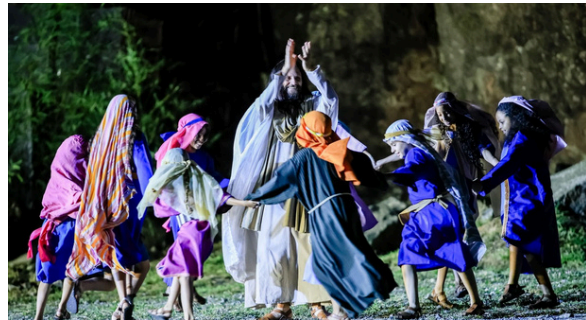
Jesus se alegra com as crianças