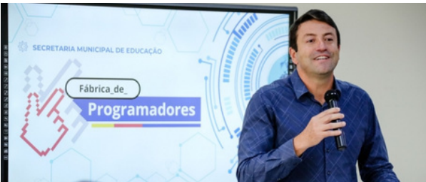
Implantação da Fábrica de Programadores