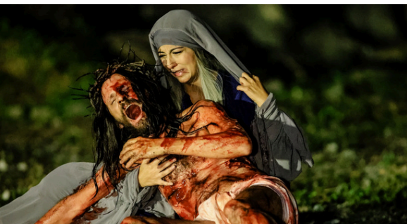
Jesus e sua mãe Maria