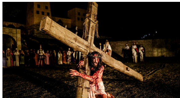
Jesus açoitado e carregando a cruz