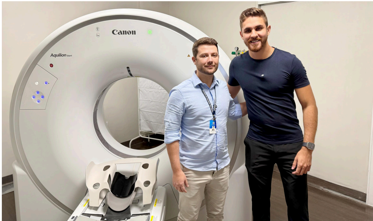
Kauan Berto também adquiriu novo aparelho de Tomografia e Ressonância Magnética

Com foco na ampliação e na agilidade do atendimento à população, o prefeito de Cajamar, Kauan Berto, anunciou nesta quarta-feira (23) a entrega de 20 novos equipamentos para o Complexo de Saúde do município. A iniciativa integra o plano da atual gestão de zerar as filas de exames e consultas em um prazo de até 30 dias. Entre os equipamentos entregues estão aparelhos de Holter (Monitora Atividade do Coração), MAPA (Monitoramento Ambulatorial da Pressão Arterial), além de aparelhos para exames de espirometria, teste ergométrico, eletroencefalograma, eletrocardiograma e polissonografia.