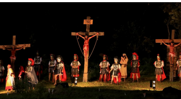
Jesus sendo crucificado emociona os fiéis