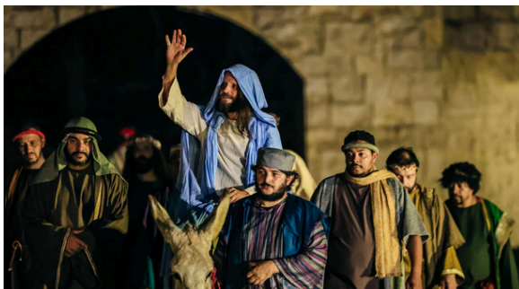
A entrada triunfal de Jesus em Jerusalém