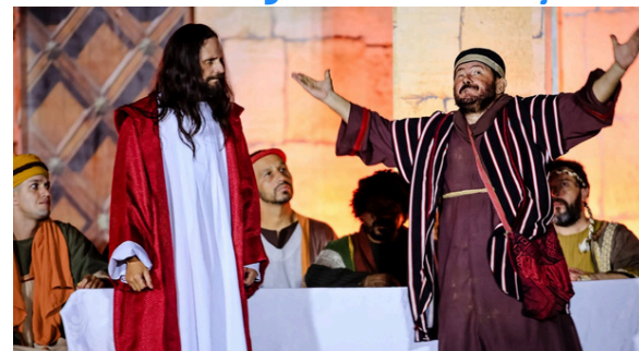
Jesus julgado pelo sinédrio