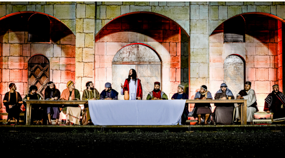
A representação da Santa Ceia