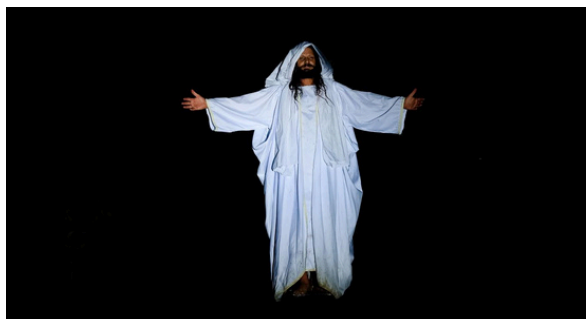
A vitória de Jesus sobre a morte na ressurreição

terceira parte abordou a prisão, morte e ressurreição do Messias.