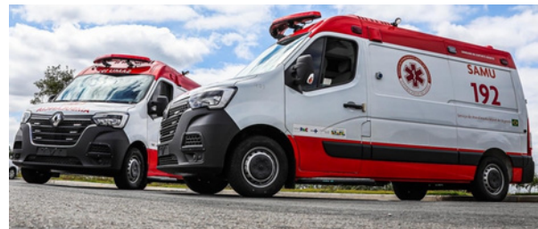
Entrega de Novas Ambulâncias do SAMU