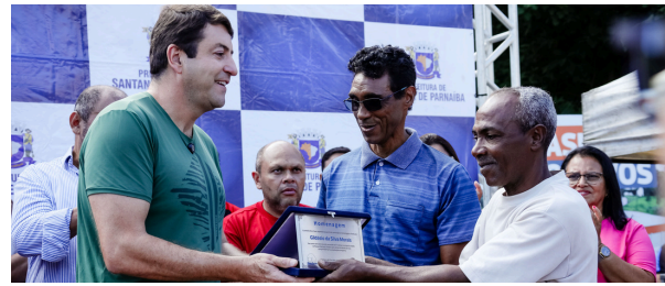
Inauguração do Campo Gildásio da Silva Moraes