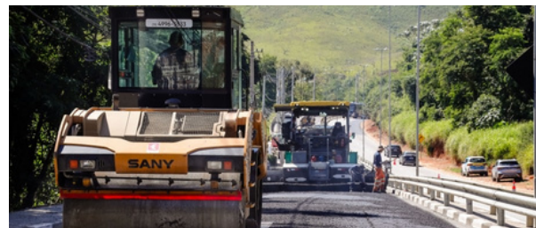
Obras de pavimentação e recapeamento asfáltico