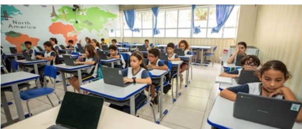
Prêmio de Excelência Educacional do Estado