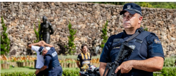
Cidade continua sendo a mais segura da região