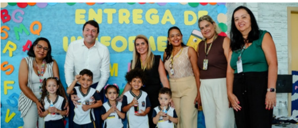
Entrega de kits de uniforme e material escolar