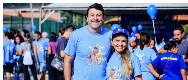
Caminhada de Conscientização sobre o autismo

lâncias do SAMU e deu celeridade nas obras da nova Unidade Básica de Saúde do bairro 120.